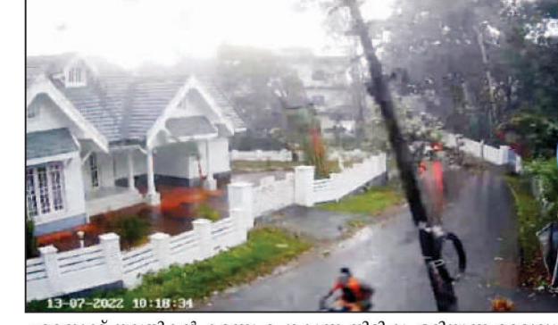
■ബൈക്ക് യാത്രികൻ കടന്നു പോകുന്ന നിമിഷം ഒടിയുന്ന വൈദ്യു ത പോസ്റ്റ്.

കോതമംഗലം: ശക്തമായ കാ • വൈറലായി ദൃശ്യങ്ങൾ റ്റിൽ വൈദ്യുതി പോസ്റ്റ് റോ ഡിലേക്ക് ഒടിഞ്ഞുവീണപ്പോൾ വാഹന യാത്രികൻ രക്ഷപെടു ന്ന ദൃശ്യം വൈറലായി. കോ തമംഗലത്ത് ഇന്നലെ ഉണ്ടായ ചുഴലിക്കാറ്റിൽ റോഡിലേക്ക് വൈദ്യുതി ്പോസ്റ്റ് ഒടിഞ്ഞു വീണപ്പോൾ ബൈക്ക് യാത്രീ കൻ രക്ഷപെടുന്നതിന്റെ സി. സി.ടി.വി. ദൃശ്യമാണ് വൈറലാ യത്. തൊട്ട് മുമ്പ് ഇതുവഴി കട ന്നു പോയ കാറുകാരൻ മരം റോഡിലേക്ക് വീഴുമ്പോൾ തല നാരിഴക്ക് രക്ഷപെടുന്നതിന്റെ യും ദൃശ്യം ഈ വീഡിയോയിൽ കാണാൻ കഴിയും. മലയിൻകീ ഴ് – നാടുകാണി റോഡിൽ ഗൊ